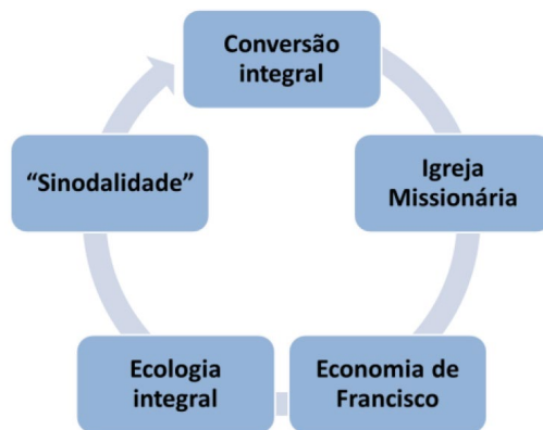
Figura: Ecossistema da Dignidade Integral – Papa Francisco

Vale lembrar que o termo ecossistema é utilizado pelo Papa e pelos cientistas, inicialmente, no contexto da ecologia, mas expandido para uma série de outros aspectos, quando se quer indicar algo que é consistente em seu conjunto, integral em sua ação e evolutivo em sua história. Com fins didáticos, passo a definir o Ecossistema a seguir, sintetizando-o na figura abaixo.